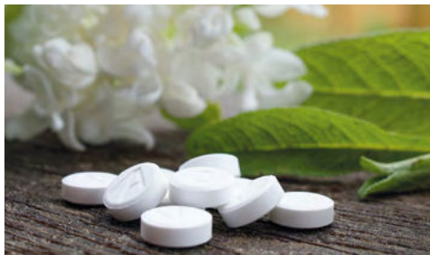
Kann bei nervöser Unruhe, mental wie motorisch, hilfreich sein - Ergänzungsalz Nr. 14, Kalium bromatum.

dennoch aufgekratzt und kann nicht abschalten. Wer zwischen 23 Uhr und 1 Uhr nachts aufwacht, für den ist die Nr. 2 geeignet. Wer plötzlich starkes Herzklopfen beim Liegen im Bett verspürt, auch für den ist es geeignet. Kinder, die mit nächtlichen Wachstumsschmerzen aufwachen brauchen die Nr. 2, auch als Salbe direkt am Schmerzort.